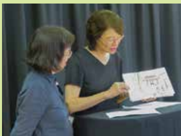
講師による作品の講評