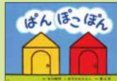
『ぼんぼこぼん』 脚本 矢代貴司 絵 ひろかわさえこ 監修 佐々木宏子