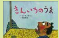
『きんいろのうま』 脚本 おかもとあつし 絵 伊藤秀男