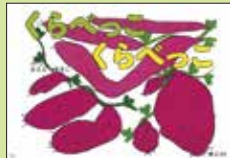
『くらべっこ くらべっこ』 脚本・絵 まえとくあきこ