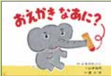
『おえかきなあに?』 脚本 ふるのれいこ 絵 山本祐司 監修 佐々木宏子