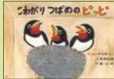
『こわがりつばめのピッピ』 脚本 こいずみゆうこ 絵 福田岩緒