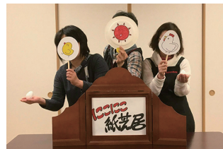
♪オープニングはたまごのうたです

2016年、読み聞かせボランティアの仲間の中から紙芝居を演じてみたい3人が集まりました。定期的なお話会ではなく、声をかけていただけたら、どこへでも行かせていただく、「出前お話会」としてスタートしました。交流センターまつりを皮切りに、町内会、子ども会、学童保育、老人保健施設、いろいろな場所で行います。