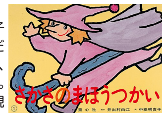
『さかさのまほうつかい』

「こどもが演じる体験コーナー」もすっかり定着して、「今日はこのためにだけ図書館に来ました」と言った子もいました。 「紙芝居の演じ方小冊子」を使って説明した後、『みんなでぼん！』と『チンパンジーのおながかい』を実演し、5グループに分かれて練習後発表です。 なんと！11回も子どもたちが演じてくれました。 『さかさのまほうつかい』を演じた小2の子は大人顔負けの演じ方でした。 パパと演じた3歳の子も真剣でした。1回だけでは物足りないので、2回目に挑戦する子も。 こどもの理解力と表現力に脱帽です！