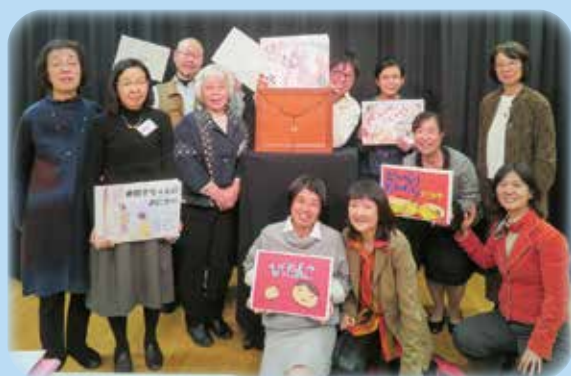
創りあげた作品を手に、喜びが広がる(創作講座2017年より)